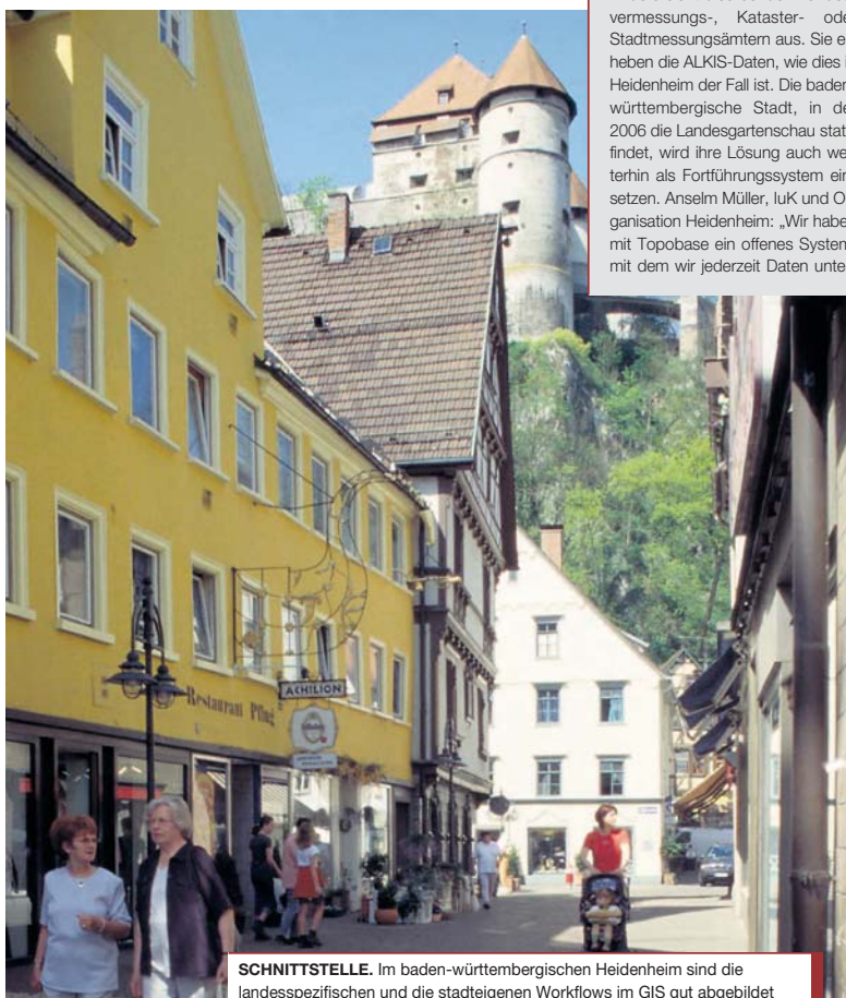
SCHNITTSTELLE. Im baden-württembergischen Heidenheim sind die landesspezifischen und die stadteigenen Workflows im GIS gut abgebildet

la). Auch der Zeitaufwand und die Kosten für Postwege, Porto, Kopien und Plansuche hätten sich deutlich reduziert (siehe Grafik).