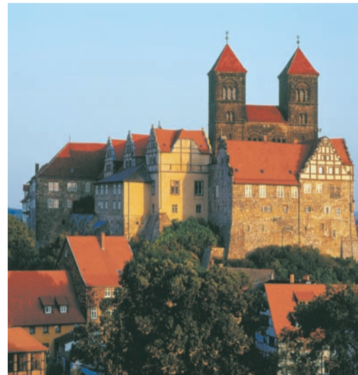
Gefährdetes Unesco-Weltkulturerbe Schloss Quedlinburg.

Dabei macht Civil 3D keinen Unterschied zwischen CAD- und GIS-Daten. Hoch- und Tiefbauamt greifen genauso auf die Daten zu wie Ingenieurbüros,